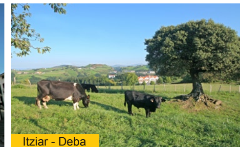
Itziar - Deba

Sin embargo, dado su alejamiento con respecto a la orilla del mar y al valle del Deba, lugares que canalizaban ya las principales relaciones comerciales de la zona, en 1343 la cabecera de la villa fue trasladada a Deba.