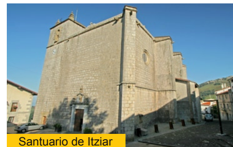
Santuario de Itziar