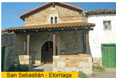
San Sebastián - Elorriaga

El Santuario de Itziar es otro hito jacobeo vasco por la presencia de su virgen, una de las más antiguas de Gipuzkoa, y la creencia de que protegía a los peregrinos de enfermedades hasta su llegada a Santiago. Durante siglos el santuario de Nuestra Señora de Itziar ha sido cita de peregrinaciones y objeto de gran devoción, en especial, entre los marineros y pescadores de Gipuzkoa. En el santuario son aún visibles varios exvotos donados en señal de acción de gracias por los marineros de la zona a lo largo de los siglos. No en vano a la virgen de Itziar se le atribuye como a ninguna otra el apelativo de Itzasoko Izarra , “Stella Maris” o “Estrella del Mar”. La virgen de Itziar es una preciosa talla románica, obra posiblemente del siglo XII, y una de las dos únicas vírgenes de este estilo existentes en toda Gipuzkoa. La importancia de Itziar se manifiesta ya durante la Alta Edad Media, alrededor del siglo XII, y es en 1294 cuando accede a rango de villa.