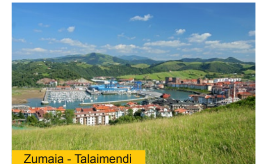
Zumaia - Talaimendi