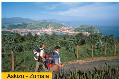
Askizu - Zumaia

Desde Askizu la ruta prosigue hacia Zumaia a través de pistas, recorrido que avanza ofreciéndonos extraordinarias vistas de la costa y especialmente de la ubicación privilegiada de la propia villa sobre la ría del Urola, población que finalmente alcanzaremos tras un progresivo descenso. Cruzaremos la carretera de la costa N-634, junto a la playa de Santiago, lugar donde nos recibirá el conjunto de la ermita de Santiago y la antigua hospedería de peregrinos. En ausencia de los modernos puentes los viajeros, comerciantes y peregrinos hacían un alto en el camino a la espera de la embarcación que los trasladara al otro lado de la ría, embarcadero que se situaba precisamente cerca de esta ermita.