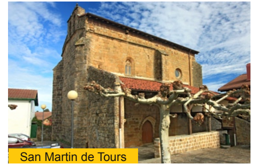
San Martin de Tours

En Askizu recibe al visitante la hermosa parroquia rural de San Martin de Tours, santo estrechamente vinculado a las peregrinaciones jacobeanas ya presente en etapas anteriores. Se trata de la principal joya del gótico rural de Gipuzkoa, así como la manifestación más antigua que de este estilo existe hoy día en todo su territorio,