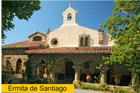
Ermita de Santiago