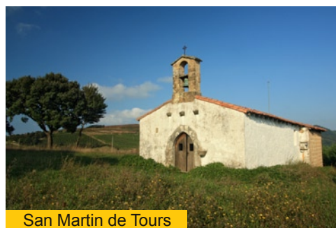
San Martin de Tours

El camino continúa a media ladera sobre los últimos relieves que enmarcan el final de la ría, hasta que varios cientos de metros más adelante la senda desciende hasta pasar bajo el puente de la autopista A-8, y juntarse con la carretera que se dirige al nuevo puerto de Orio, frente al puerto deportivo situado al otro lado de la ría. Nos encontramos en la pequeña ensenada y playa de Oribarzar, uno de los puertos con los que en el pasado contaba Aia.