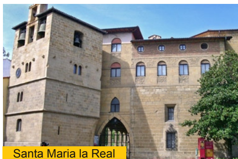
Santa Maria la Real

Otros edificios de esta y de las restantes calles del núcleo medieval de la villa son también testigos mudos de aquella época de guerreros, santos, mercaderes y peregrinos, como por ejemplo la casa Makazaga, ubicada en Musika Plaza, o la casa Dotorekoa en la calle Zigordia. En el otro extremo de la calle, marcando la salida de la villa, se ubica otra casa-torre, llamada Kanpantorrea o “torre del campanario”. Este edificio, además de acoger el campanario de la parroquia contigua, fue durante siglos la sede del concejo o ayuntamiento de la villa. Durante mucho tiempo la Kanpantorrea municipal constituyó además un contrapoder frente a las pretensiones y ambiciones de los señores de Zarauz, que desde principios del siglo XIV eran patronos de la parroquia de Santa María la Real, y cuya casa-torre, ya desaparecida, se situaba muy cerca de aquí. Desde ella ejercieron su dominio los Zarauz, uno de los principales linajes que comandaban el bando señorial de Ganboa, el cual durante la Baja Edad Media sembró muerte y destrucción en su secular enfrentamiento con su oponente